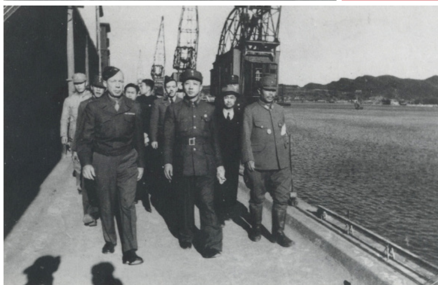
下图：中美代表在台湾视察日军投降。